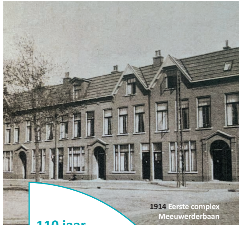
1914 Eerste complex Meeuwerderbaan